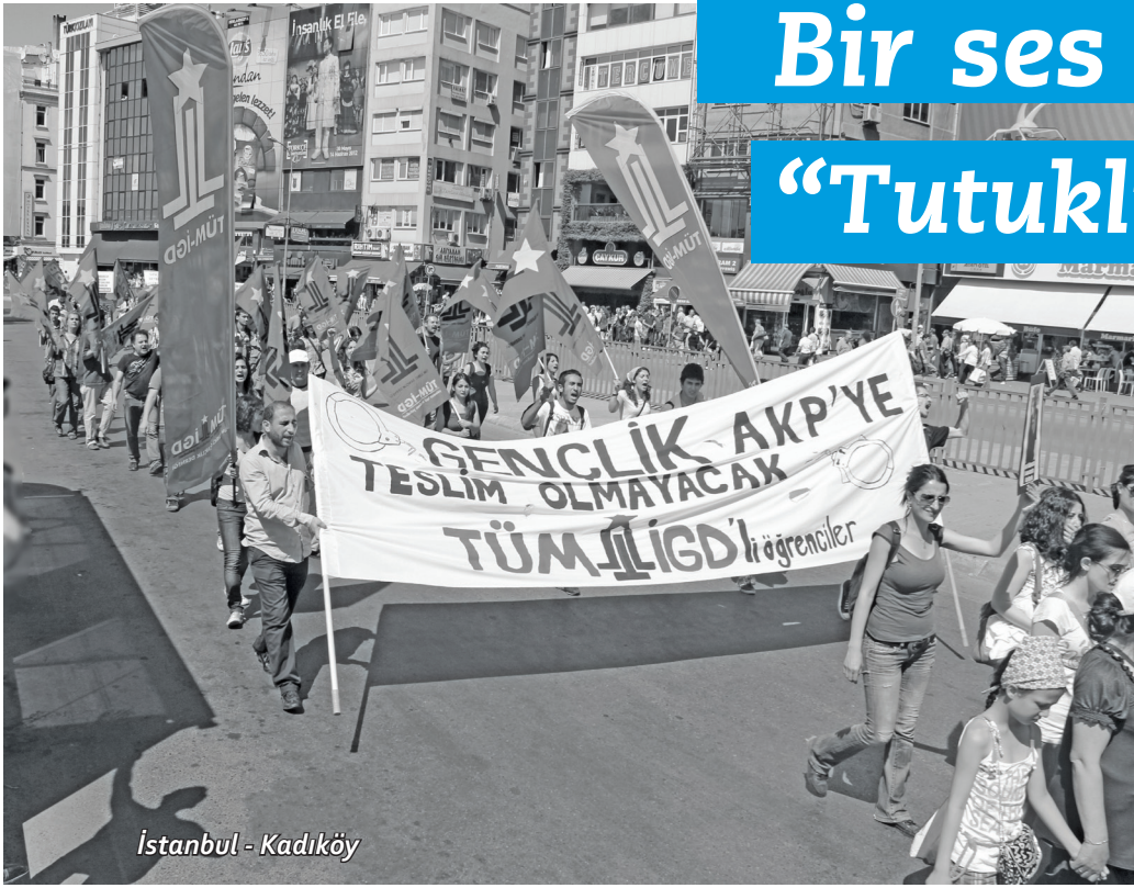
İstanbul - Kadıköy