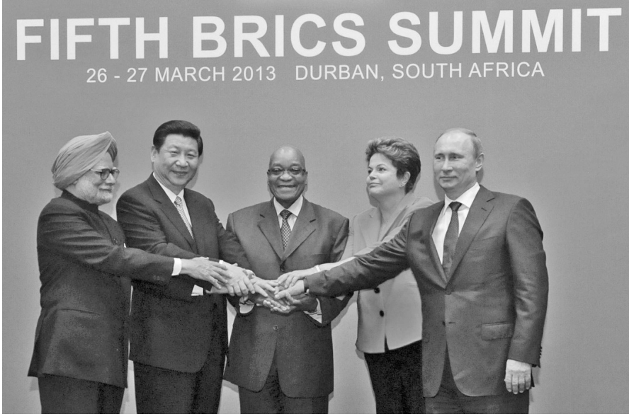
FIFTH BRICS SUMMIT 26 - 27 MARCH 2013 DURBAN, SOUTH AFRICA

Önemli bir ekonomik güç odağı oluşturan bu ülkeler, zirvede küresel politika ve ekonomik işbirliği konularını ele aldı. Zirvede İş Konseyi kurulması kararı alınırken, ortak bir Kalkınma Bankası'nın da kurulması kararlaştırıldı.