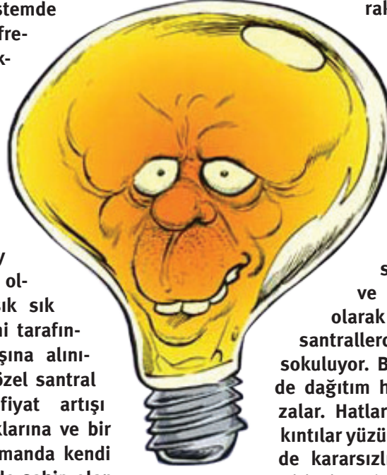
karikatür Ieman dergisi

Frekans bozukluğu aslında, belli bir orana kadar, olağan durum. İki te-