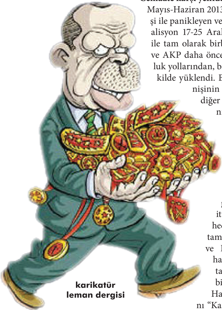
karikatür leman dergisi