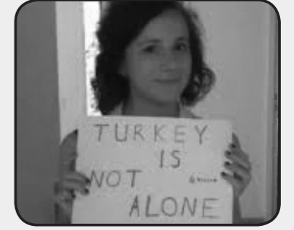
"Türkiye yalnız değil" diyen bir Erasmus öğrencisi

Gezi eylemlerine Avrupa'dan Afrika'ya, Amerika'dan Uzak Asya'ya kadar dünyanın dört bir yanından destek var. Ancak bir o kadar anlamlı ve önemli bir başka destek de Türkiye'de öğrenim gören yabancı öğrencilerden geliyor.